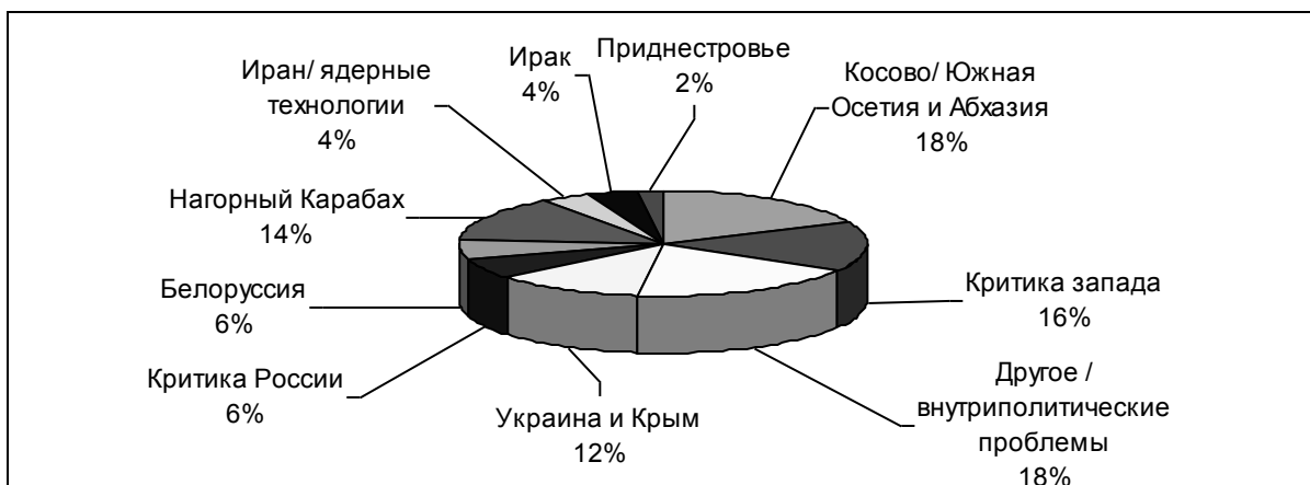
Диаграмма 2. Контекст употребления термина «политика двойных стандартов» в русскоязычных ресурсах Интернета за 2009 г. (выборочный контент-анализ 100 самых популярных ссылок)