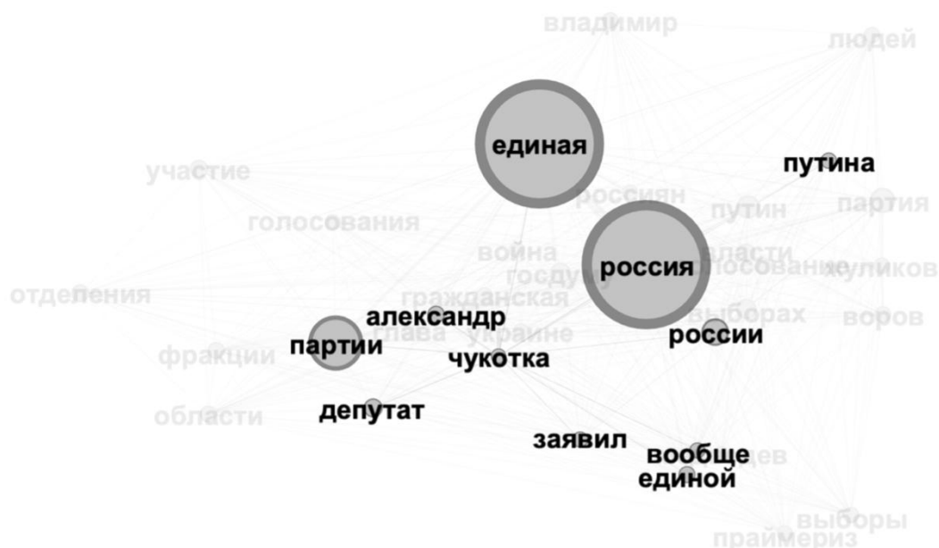
Рис. 3. Взаимосвязь узла «чукотка» с объектами ядра концептосферного поля «Единая Россия — Сеть»