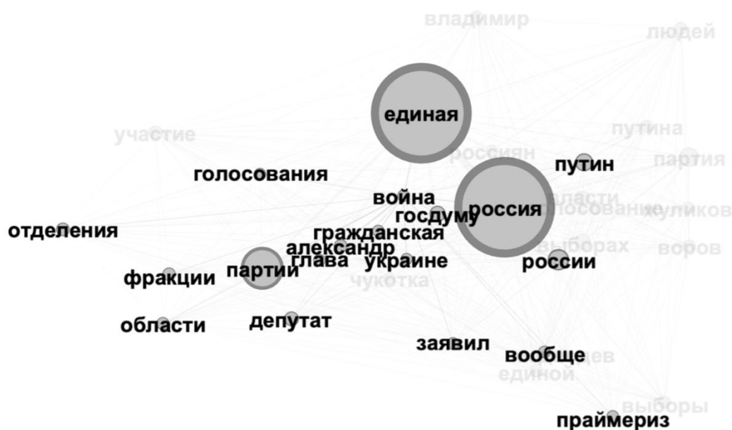
Рис. 4. Взаимосвязь узла «война» с объектами ядра концептосферного поля «Единая Россия — Сеть»

Взаимосвязь объектов в рамках ядра отражает дополнительные акценты: узлы «россия», «россии», «единая», «партии» связаны со всеми без исключения узлами ядра, что отражает ключевую роль данных концептов в обеспечении связности объектов в рамках концептосферного поля. Однако детальное изучение взаимосвязи объектов графа позволяет выявить кластеризованность объектов — такие узлы, как, например, «чукотка» или «донбассе», имеют