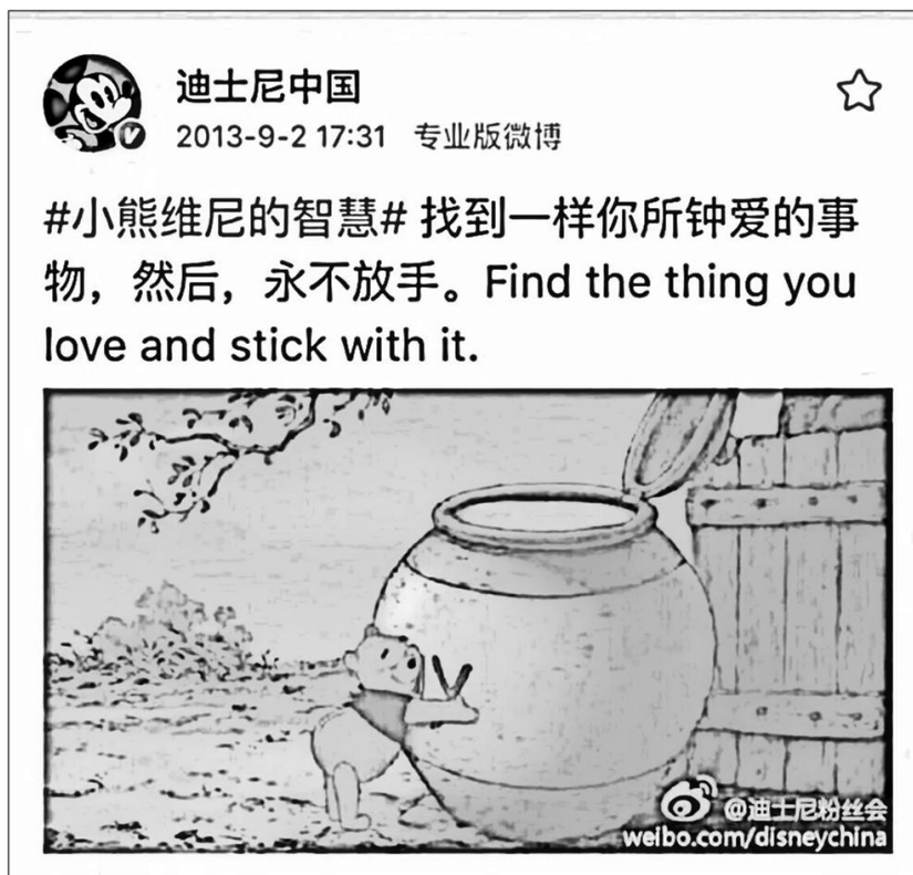
Рис. 1. «Find the thing you love and stick with it» — «Найди то, что тебе нравится, и крепко обними это» [SupChina 2018]

ны англо-саксонской лингвокультуры, художественные и медийные образы, в частности мемы с изображением диснеевских персонажей. Приведем пример из фокусирующегося на Китае американского издания "SupChina" (рис. 1).