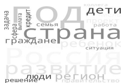
Рис. 2. Облако тегов «Послания Президента» от 2021 г.

Для 2021 года облако тегов содержит такие таксоны, как год, страна, Россия, дети, граждане, люди, решения, задача, сфера, кредит, семья, выплата, ситуация, работа, коллега, что представлено на рисунке 2.