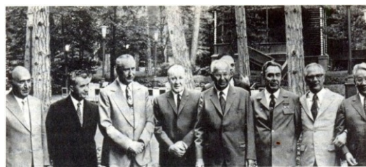
1. На фотографии справа налево: Юмжагийн Цэдэнбал (1916—1991), Эрих Хонеккер (1912—1994), Л. И. Брежнев (1906—1982), Густав Гусак (1913—1991), Янош Кадар (1912—1989), Эдвард Герек (1913—2001), Николае Чаушеску (1918—1989), Тодор Живков (1911—1998)

в странах так называемого восточного блока началась «перестройка», которая затронула всех политических лидеров стран социалистического лагеря, положив конец его существованию. В иносказательном плане в современной русской лингвокультуре название романа/фильма употребляется как прецедентный текст для описания последнего представителя какого-либо отмирающего социального явления или группы людей — сторонников каких-либо идей, отживших свое время.