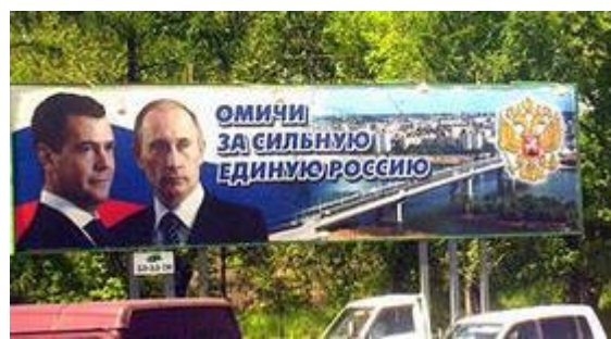
Рис. 3. Плакат 2012 г. (г. Омск)

Завершая обзор вербальных и невербальных средств создания образа «легитимирующей аудитории», отметим, что инсти-