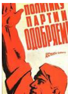
Рис. 2. Плакат 1970-х гг. (СССР)

Как всякая растиражированная практика, аплодисменты в качестве показателя лояльности стали объектом иронической рефлексии. В кинофильме «Добро пожаловать, или Посторонним вход воспрещен» (реж. Э. Климов, 1964 г.) пионер пародирует стереотипную фразу руководителя лагеря: Аплодируем, аплодируем, кончили аплодировать! Цитата из кинофильма вошла в паремнологический фонд и используется в качестве иронической реакции на официальную демонстрацию верноподданнических чувств: Товарищи, не побоюсь этого слова, друзья, уже полмесяца, как мы можем говорить не йОгурт, а йогУрт! УРА, ТОВАРИЩИ! аплодируем, аплодируем, кончили аплодировать (Комсомольская правда. 2008. № 13. 30 янв.).