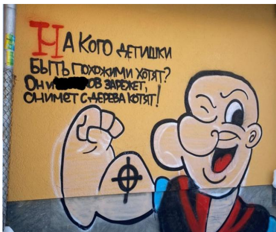
Рис. 1