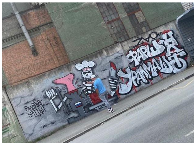
Рис. 2 1

действия по спасению животного и убийство людей по национальному признаку.