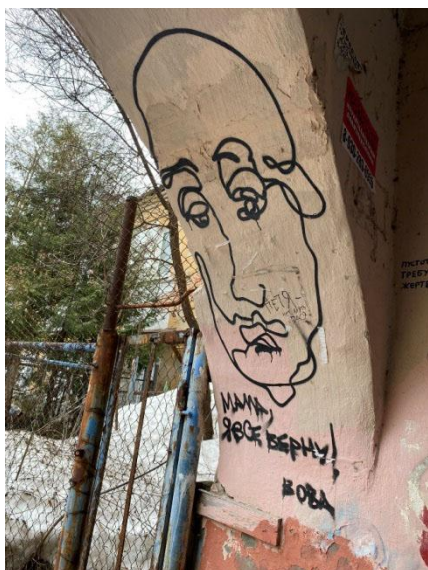
Рис. 3

На рисунках 3,4 присутствует отсылка к прецедентному имени — Путин. На рисунке 3 — легко узнаваемая визуализация образа Президента и вербальный компонент « мама, я все верну! Вова ». Визуальная часть, судя по всему, передает эмоцию печали, грусти, для кого-то, возможно, досады, стыда и вины. Вербальный компонент, представленный в форме некоего обещания, ставит изображенное лицо в позицию виноватого, стремящегося к устранению последствий, наступивших в результате определенных действий. Прибегая к такой трансляции смысла, автор как будто обвиняет указанное лицо в том, о чем адресат сам должен додумать. Такая формулировка смысла выглядит очень диалогичной: во-первых, очевидна отсылка к актуальным по-