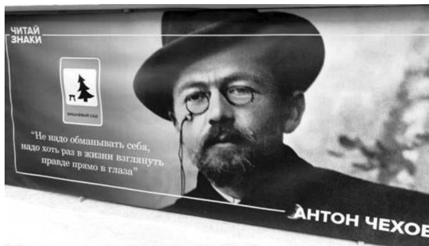
Рис. 3. ЧЕХОВ

На плакате изображен дорожный знак «Оборудованное место отдыха», дополненный надписью «Вишневый сад», отсылающей к известной пьесе А. П. Чехова, в которой тема уходящей красоты природы и прошлого противопоставляется прагматике будущего: на месте вырубленного вишневого сада предполагается строительство дачных участков и т. п. Цитата под портретом писателя («Не надо обманывать себя, надо хоть раз в жизни взглянуть правде прямо в глаза») принадлежит герою пьесы Пете Трофимову. Он адресует эти слова Раневской — владелице вишневого сада, которая не хочет и не может принять ценностные ориентиры нового рационального века, романтизируя уходящее, находясь в плену иллюзий о возможности сохранить свой привычный мир дворянского быта. Дорожный знак можно рассматривать как отражение потреби-