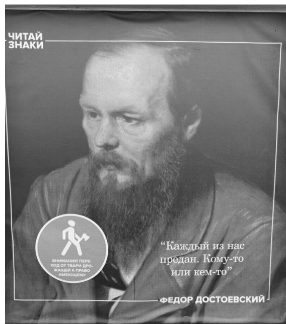
Рис. 2. ДОСТОЕВСКИЙ