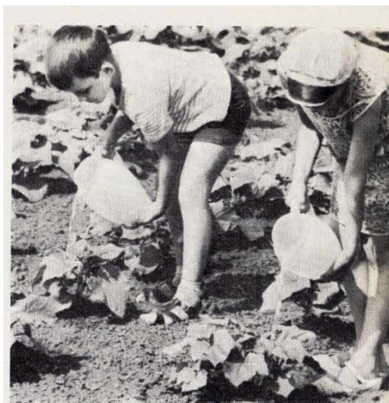
Рис. 3. Юннаты работают на своих участках. «Пионер», 1975, № 6