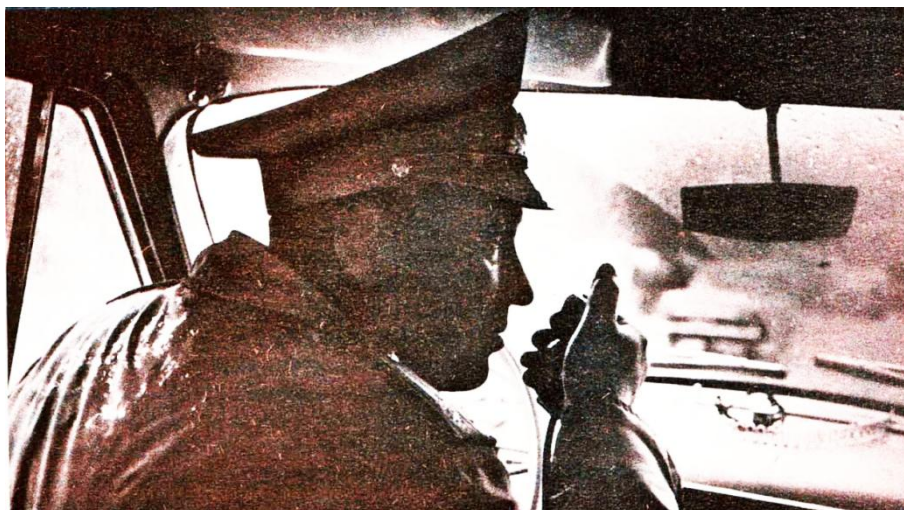
Рис. 2. Инспектор ГАИ за работой. «Пионер», 1970, № 2

• Каждый, вероятно, замечал на досках объявлений небольшие листочки, где жирным типографским шрифтом напечатаны слова: «Требуются рабочие...» Требуются рабочие, инженеры, мастера, шоферы («Пионер», 1973, № 1).