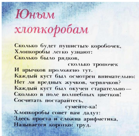
Рис. 4. Стихотворение о труде юных хлопкоробов. «Пионер», 1986, № 6

Доминирующий тип репрезентаций вознаграждения определяется отношением к нему как вторичному аспекту трудовой деятельности, в то время как ключевым аспектом выступает удовольствие от процесса труда и удовлетворение от результата: