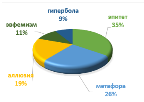
Рис. 1. Коммуникативно-прагматические средства, способствующие моделированию мелиоративного образа полиции в израильском газетном дискурсе

Критические материалы, как правило, подчеркивают недостатки в работе органов внутренних дел, такие как рост уровня преступности или неспособность обеспечить общественную безопасность (33 контекста). Так, пейоративный образ правоохранителей актуализируется в большинстве случаев за счет косвенных внутритекстовых оценок, способствующих общественному обсуждению проблем и необходимости проведения реформ в правоохранительной сфере. Основными лингвистическими средствами оказания негативного воздействия на сознание адресата выступают метафоры (28 % — 9 контекстов), эпитеты (24 % — 8 контекстов), ирония (18 % — 6 контекстов), гиперболы (15 % — 5 контекста), сравнения (6 % — 2 контекста), а также повтор отрицательно-маркированных лексем (9 % — 3 контекста) (рис. 2).