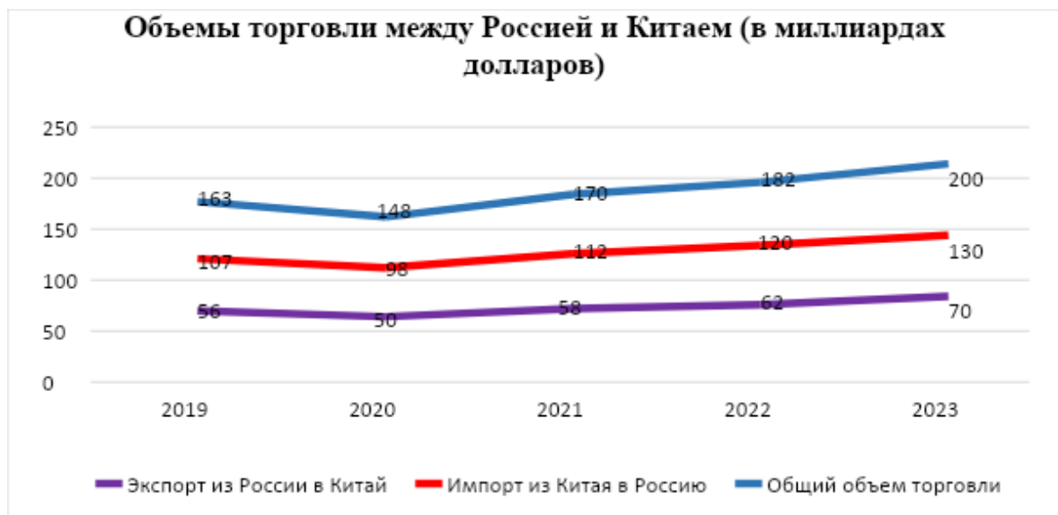
Рис. 1. Динамика объемов торговли между Россией и Китаем