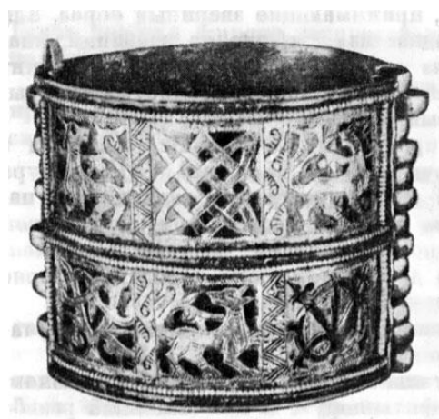
Рис. 2. Браслет с изображениями птиц, символов земли, растительности и трех волков (взято из работы: [Рыбаков 1988: 732])