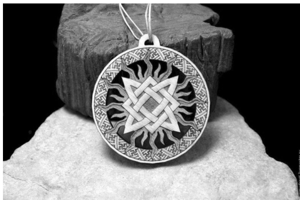
Рис. 3. «Славянский» символ «Звезда Руси» на автомобиль с описанием: «Символ Звезда Руси соединил в себе жизнеутверждающие символы движения и следования своей природе. Древний оберег славян поддерживает в своем носителе независимость, гармонию с самим собой, миром, непоколебимость и веру в себя»