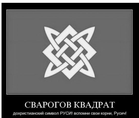
Рис. 1. «Сварогов квадрат» — символ «Северного братства»

В настоящее время этот символ в массовом сознании прочно ассоциируется со Сварогом и славянской языческой древностью, являясь элементом «этнических» украшений, магазинов, продающих вещи со «славянской» символикой, и даже фирм, оказывающих дизайнерско-строительные и электромонтажные услуги (см. рис. 3, 4, 5).