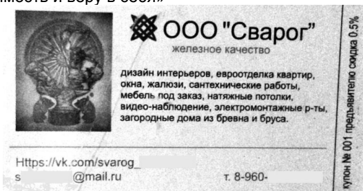
Рис. 5. Визитка фирмы, оказывающей услуги в области дизайна интерьеров, строительства и электромонтажных работ